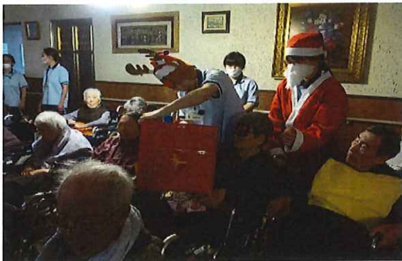
箱の中身当てゲームの様子

令和元年12月22日(日)当施設1階ホールにて東長崎ナーシングホームクリスマス会を開催しました。箱の中身当てゲーム・職員による紅白歌合戦とハンドベルを行い楽しみました。