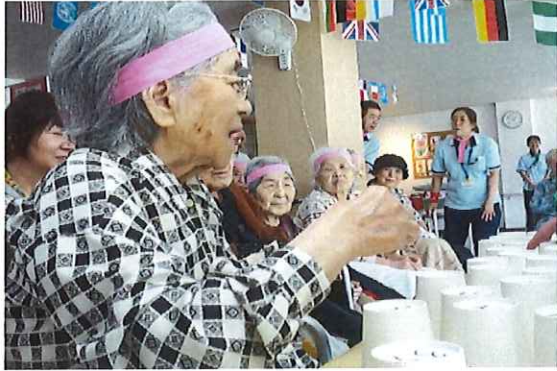
お宝は何が当たるかな？

令和元年10月26日(土)当施設1階リハビリ室にて東長崎ナーシングホーム運動会を開催しました。今年も通所と入所合同で開催し、お宝探し・ボールキャッチ(職員対決)・バランスゲーム・物送りゲームなどで楽しみました。