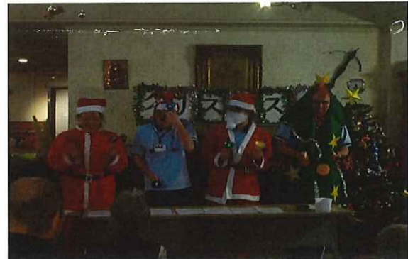
職員によるハンドベル！一生懸命練習しました