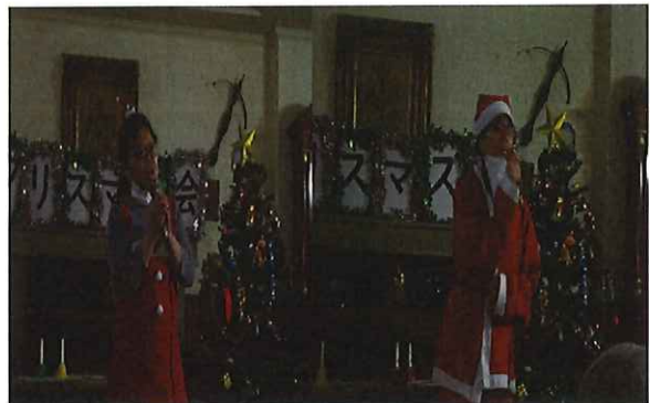
職員新人2名による紅白歌合戦！盛り上がりました