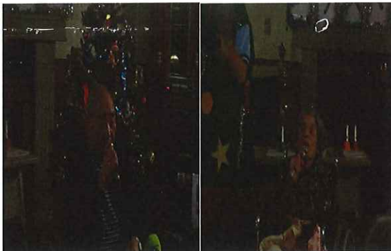
急遽、入所の方も歌いました。真剣です。