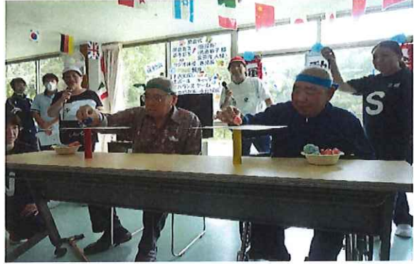
ドキドキのバランスゲームの様子