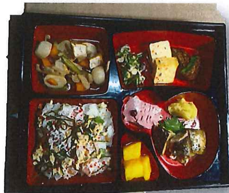
5月・こどもの日お重